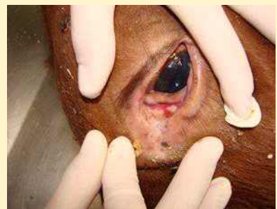
<눈 분비물 증가>