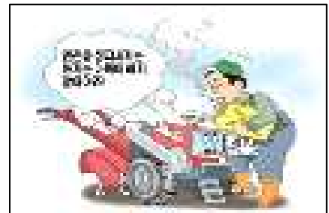
<연료급유시 화기 주의>