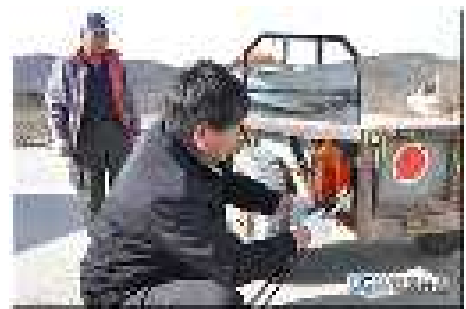
<등화장치 및 반사판 부착>