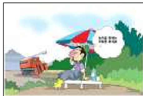
<농작업 2시간 마다 휴식>