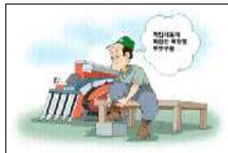
<작업에 적합한 복장 착용>