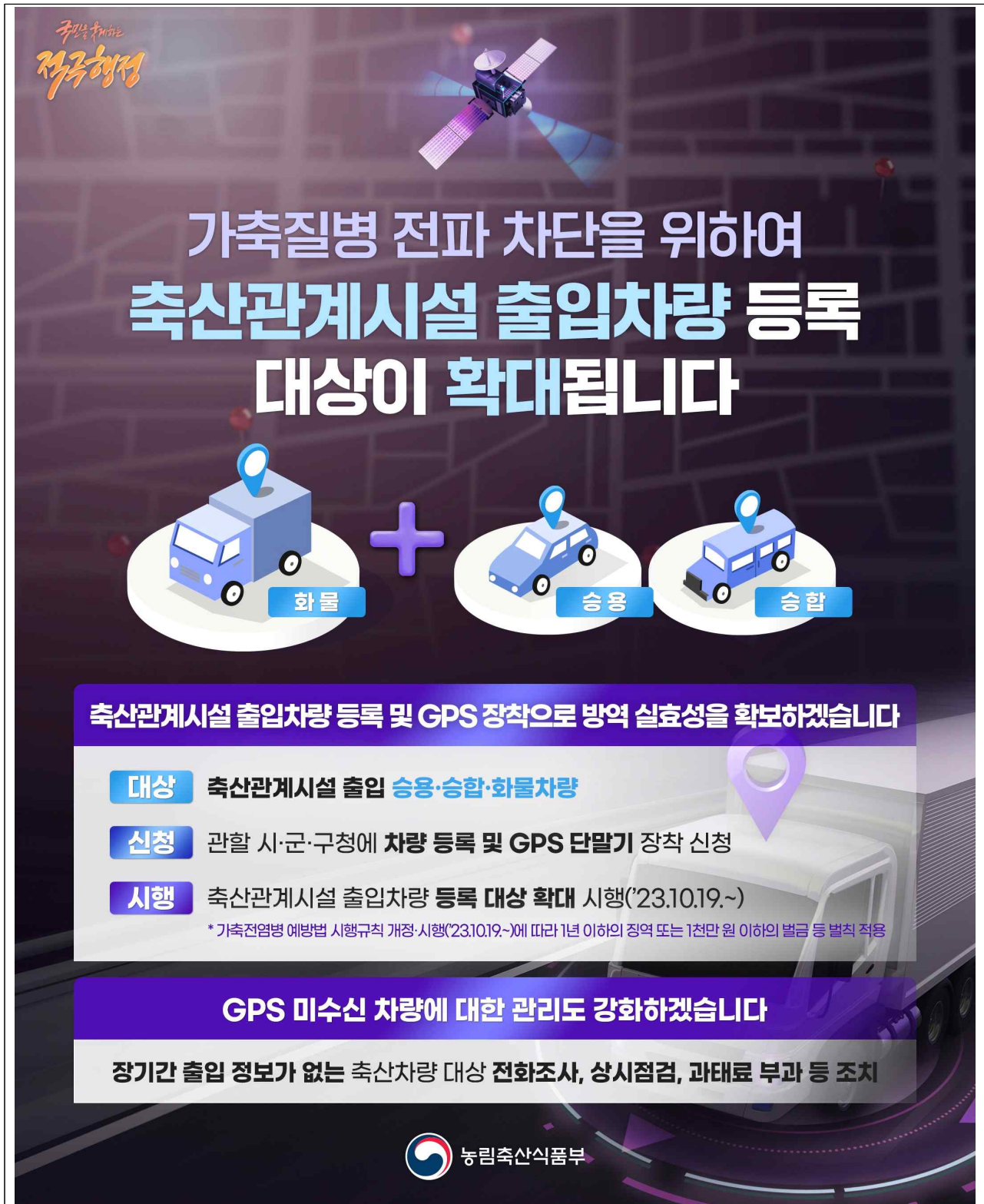
【붙임 12】 축산관계시설 출입차량 등록대상 확대 관련 홍보 포스터