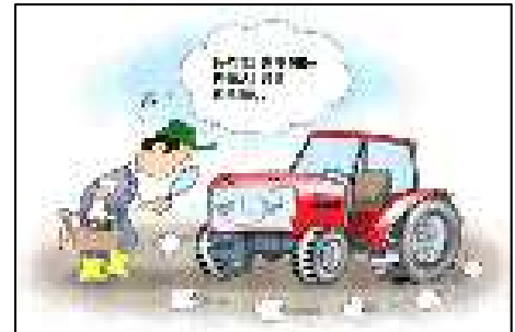
< 농작업 전후 점검·정비 >