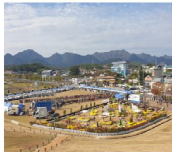
농축산물 한마당 축제