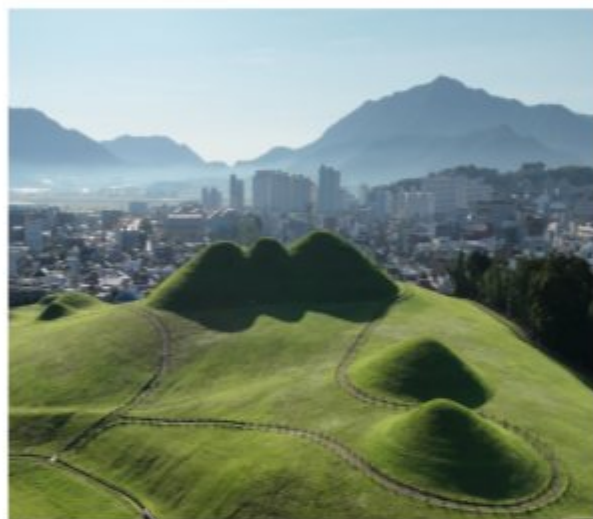
유네스코 세계유산 송학동고분군