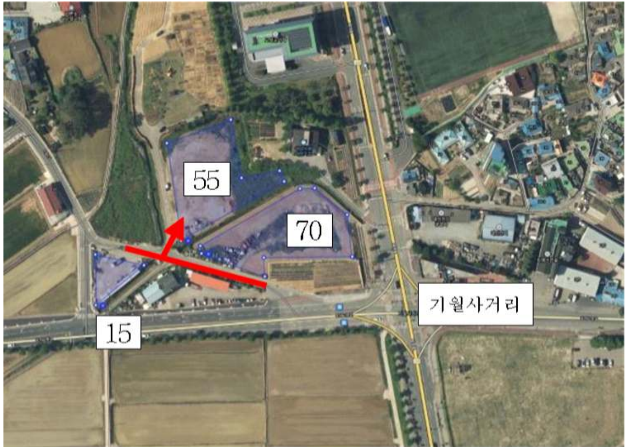
【붙임 1】 의회 주변 임시주차장 위치도