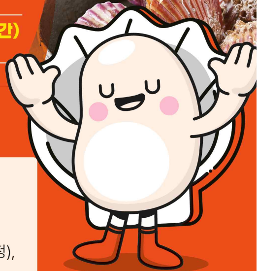
가리비축제 캐릭터 - 리비