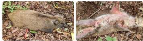
〈전형적인 증상 : 피부가 붉은색으로 변함〉

※ 산행중 부패한 냄새가 심하게 나면 주변에 폐사체가 있을 가능성이 높음