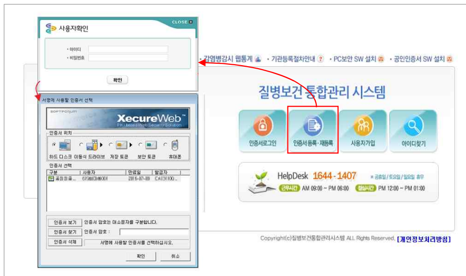
<그림 4. 질병보건통합관리시스템 인증서등록>