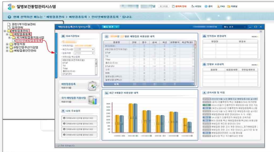
<그림 11. 예방접종등록관리 정보시스템 접속 화면>