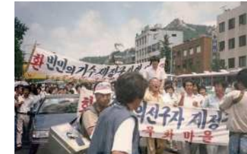
6월 항쟁의 열기 속에서 (1987년)