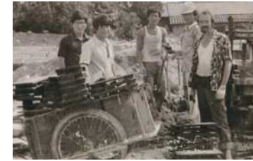
복음자리 마을 건설 현장에서 주민들과 함께 (1977년)