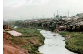
1972년 당시의 청계천