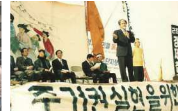
빈민의 주거권 실현을 위한 집회 현장에서 (1990년대)