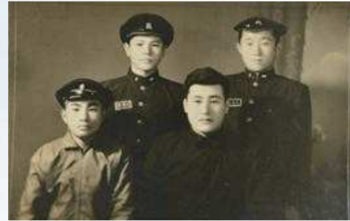
고교시절 형제들과 함께(1960년대 초반)