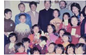
양평동 판자촌 시절 김수환 추기경과 함께 (1960년대 중반)